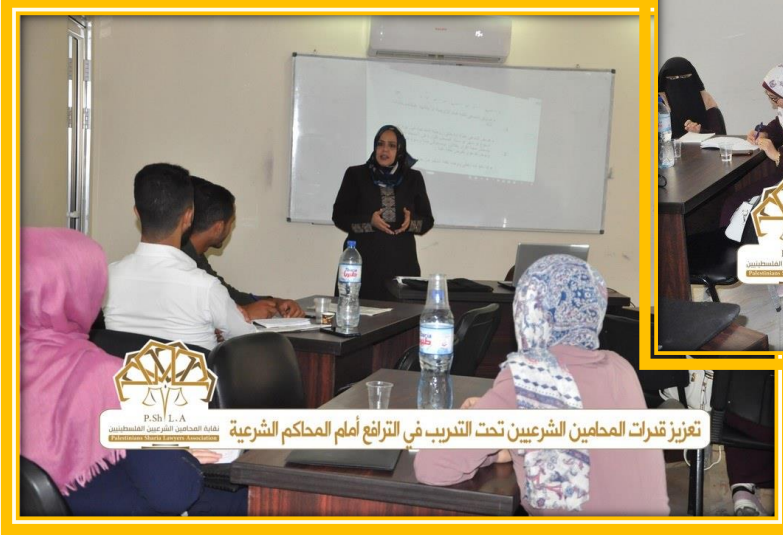
تعزيز قدرات المحامين الشرعيين تحت التدريب في الترافع أمام المحاكم الشرعية

محاضرة من سلسلة محاضرات لجنة التدريب بهدف تعزيز قدرات المحامين الشرعيين تحت التدريب في الترافع أمام المحاكم الشرعية (تحت عنوان دعاوي النفقات بين النظرية والتطبيق).