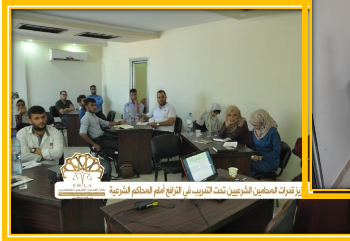
تعزيز قدرات المحامين الشرعيين تحت التدريب في الترافع أمام المحاكم الشرعية

محاضرة من سلسلة محاضرات لجنة التدريب بهدف تعزيز قدرات المحامين الشرعيين تحت التدريب في الترافع أمام المحاكم الشرعية (تحت عنوان دعاوي النفقات بين النظرية والتطبيق).