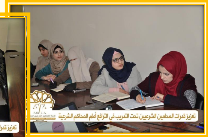
تعزيز قدرات المحامين الشرعيين تحت التدريب في الترافع أمام المحاكم الشرعية