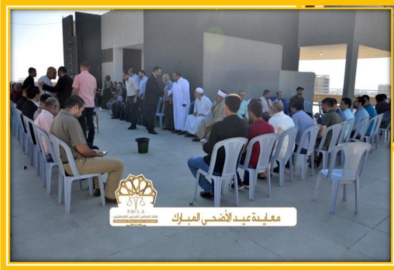
معيدة عيد الأضحى المبارك