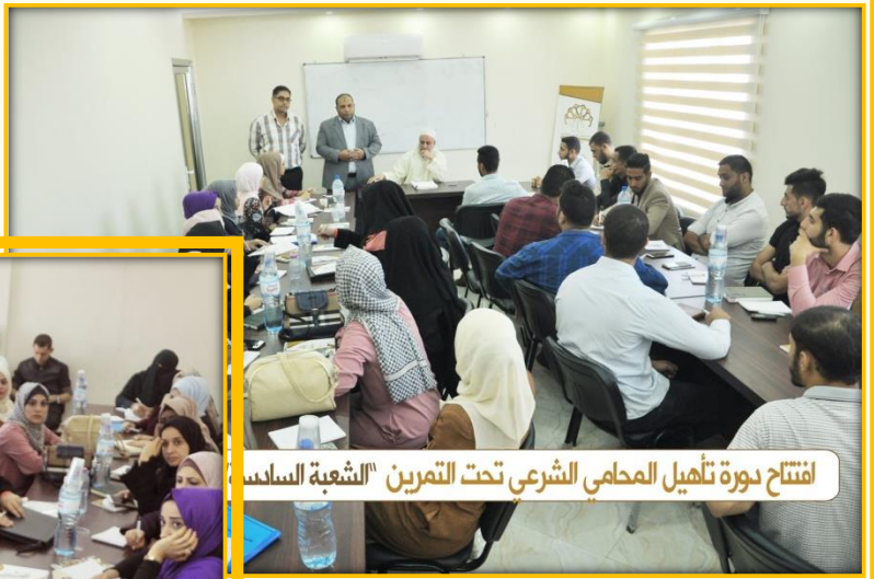
افتتاح دورة تأهيل المحامي الشرعي تحت التمرين "الشعبة السادسة"

افتتاح دورة تأهيل المحامي الشرعي تحت التدريب لتمكين المحامين الشرعيين المتدربين من اجتياز امتحان المزاولة.