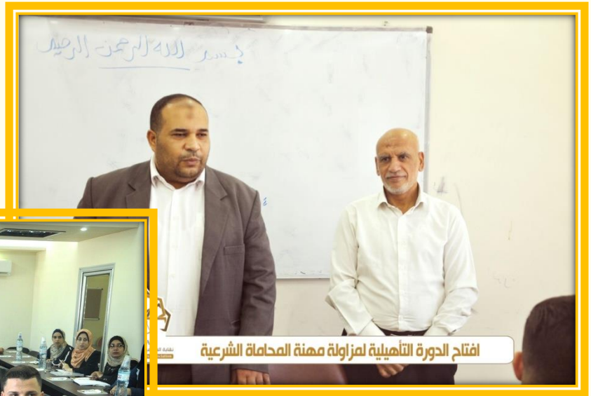
افتتاح الدورة التأهيلية لمزاولة مهنة المحاماة الشرعية

افتتاح دورة تأهيل المحامي الشرعي تحت التدريب لتمكين المحامين الشرعيين المتدربين من اجتياز امتحان المزاوله.