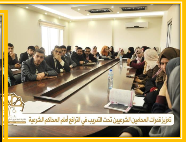
تعزيز قدرات المحامين الشرعيين تحت التدريب في الترافع أمام المحاكم الشرعية