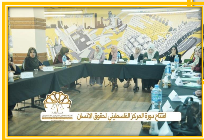
افتتاح دورة المركز الفلسطيني لحقوق الانسان

افتتاح دورة المركز الفلسطيني لحقوق الانسان لتمكين المحامين الشرعيين المتدربين من اجتياز امتحان المزاولة بغزة.