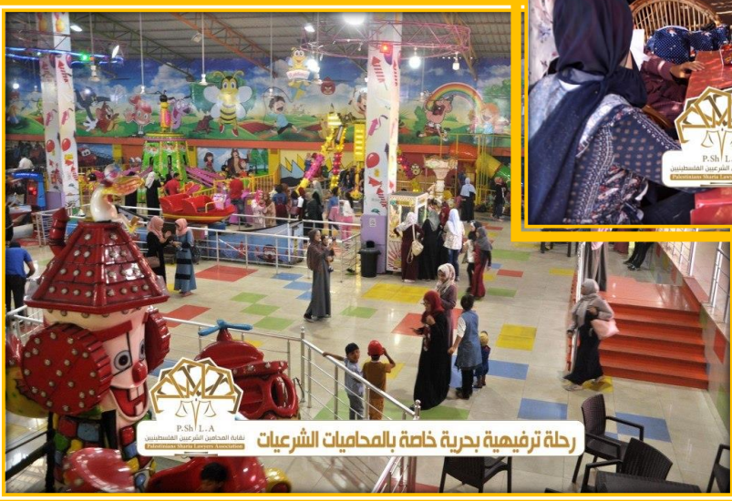
رحلة ترفيهية بحرية خاصة بالمحاميات الشرعيات