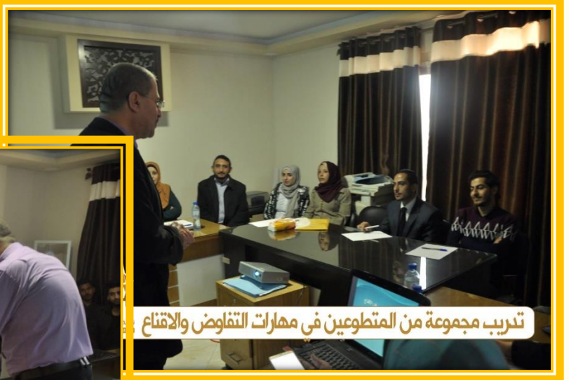
تدريب مجموعة من المتطوعين في مهارات التفاوض والإقناع

تنظيم ورشة عمل بعنوان "مهارات التفاوض والإقناع والتأثير" استهدفت مجموعة من المتطوعين في النقابة.