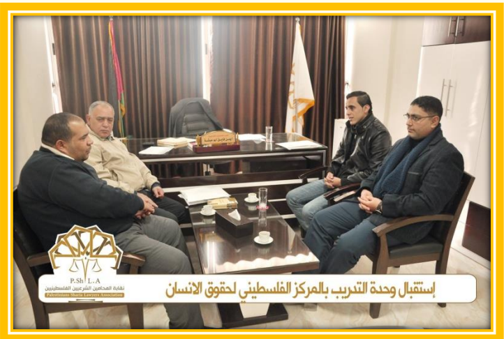
استقبال وحدة التدريب بالمركز الفلسطيني لحقوق الانسان