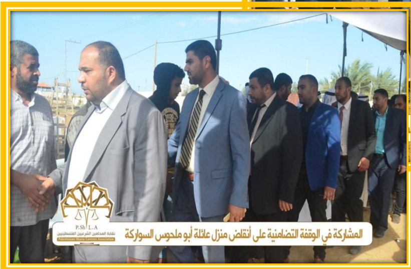
المشاركة في الوقفة التضامنية على أنقاض منزل عائلة أبو ملحوس السواركة