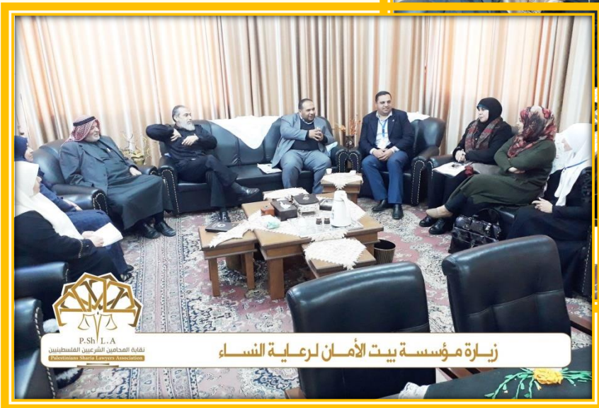
زيارة مؤسسة بيت الأمان لرعاية النساء