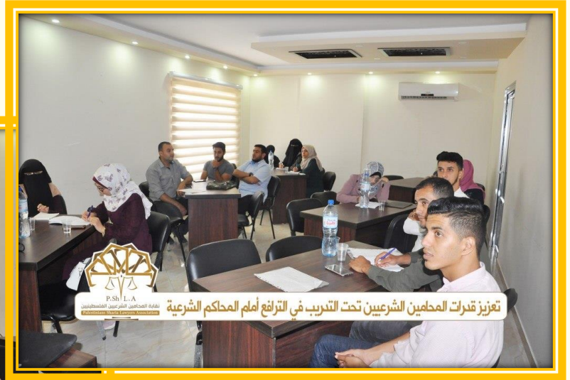
تعزيز قدرات المحامين الشرعيين تحت التدريب في الترافع أمام المحاكم الشرعية