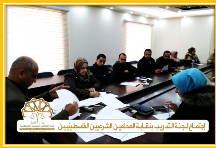
اجتماع لجنة التدريب بنقابة المحامين الشرعيين الفلسطينيين

* اجتمع لجنة التدريب بمقر النقابة بحضور أعضاء لجنة التدريب لمناقشة الأمور والمقترحات والأفكار لعقد دورات متخصصة للمحامين الشرعيين المتدربين المسجلين في النقابة.