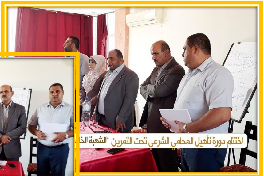
اختتام دورة تأهيل المحامي الشرعي تحت التمرين "الشعبة الخامسة"

اختتام دورة تأهيل المحامي الشرعي تحت التدريب لتمكين المحامين الشرعيين المتدربين من اجتياز امتحان المزاولة لمحافظتي خانيونس ورفح.