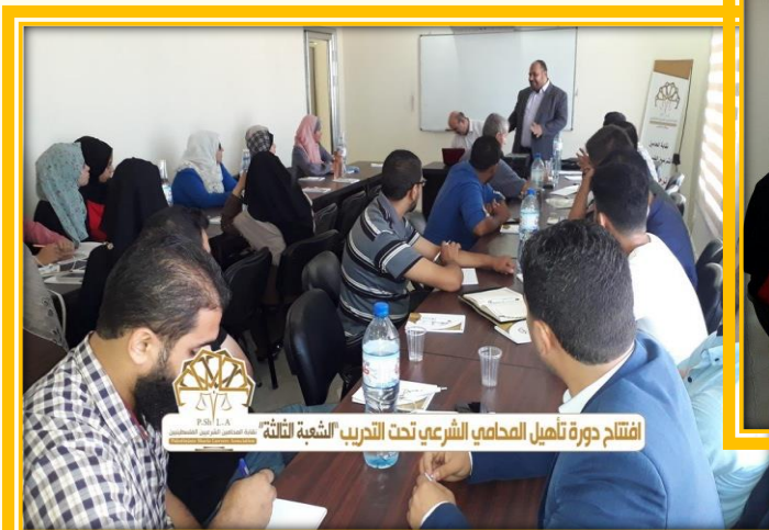
افتتاح دورة تأهيل المحامي الشرعي تحت التدريب الشعبة الثالثة

افتتاح دورة تأهيل المحامي الشرعي تحت التدريب لتمكين المحامين الشرعيين المتدربين من اجتياز امتحان المزاولة.