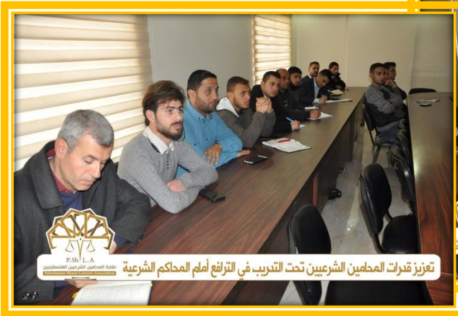
تعزيز قدرات المحامين الشرعيين تحت التدريب في الترافع أمام المحاكم الشرعية

محاضرة من سلسلة محاضرات لجنة التدريب بهدف تعزيز قدرات المحامين الشرعيين تحت التدريب في الترافع أمام المحاكم الشرعية (تحت عنوان دعاوي النفقات بين النظرية والتطبيق).