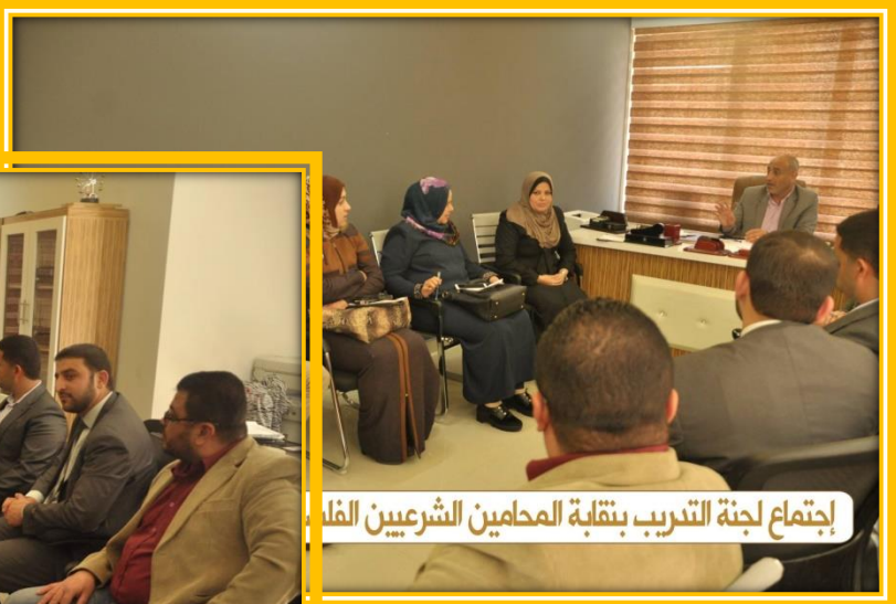
اجتماع لجنة التدريب بنقابة المحامين الشرعيين الفلسطينيين

اجتماع لجنة التدريب بنقابة المحامين الشرعيين الفلسطينيين.