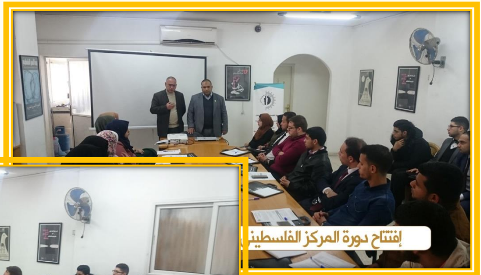
إفتتاح دورة المركز الفلسطيني

افتتاح دورة المركز الفلسطيني لحقوق الانسان في خانيونس.