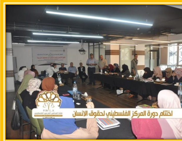
اختتام دورة المركز الفلسطيني لحقوق الانسان

اختتام دورة المركز الفلسطيني لحقوق الانسان.