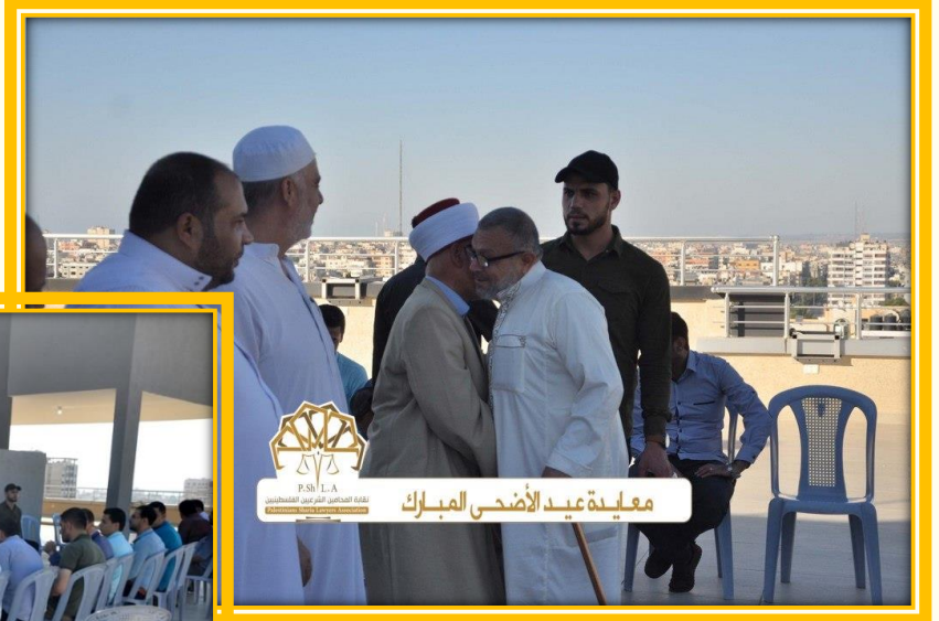
معيدة عيد الأضحى المبارك

نظمت نقابة المحامين الشرعيين الفلسطينيين لقاء لتبادل التهاني بعيد الأضحى المبارك.. حيث حضر اللقاء ما يزيد عن ٢٢٠ محامي ومحامية وبحضور أصحاب الفضيلة أعضاء المجلس الأعلى للقضاء الشرعي وقضاة المحكمة العليا الشرعية وقضاة محكمة الاستئناف الشرعية. و تبادل المحامون والمحاميات والقضاة التهاني بمناسبة العيد.