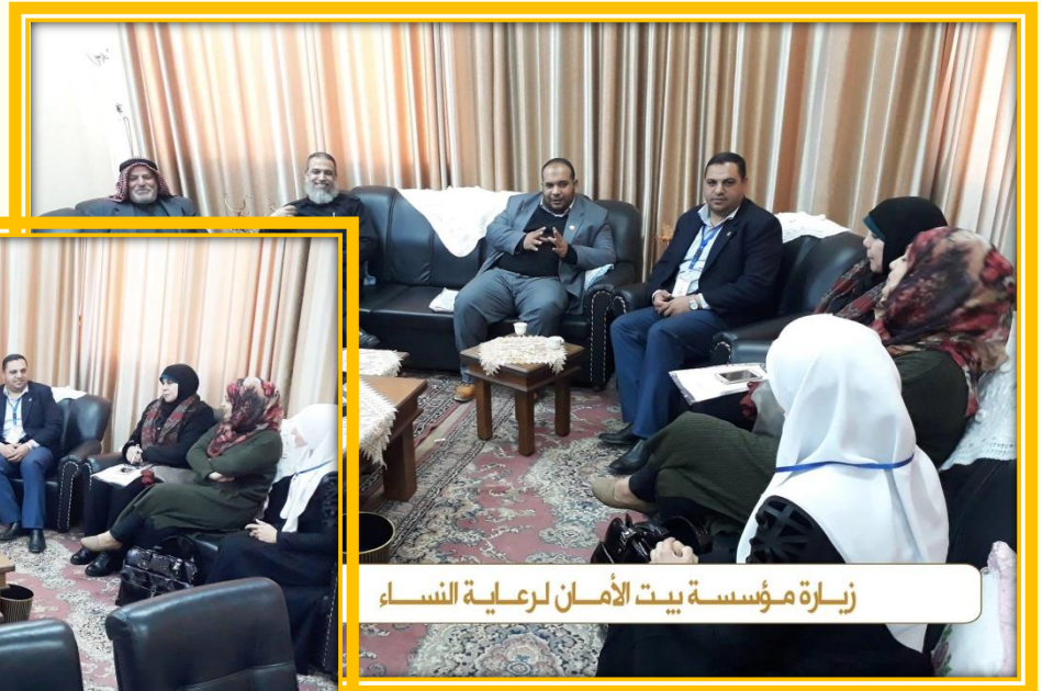
زيارة مؤسسة بيت الأمان لرعاية النساء

زيارة وفد من نقابة المحامين الشرعيين لمؤسسة بيت الأمان لرعاية النساء وذلك لبحث سبل التعاون فيما بين النقابة والمؤسسة.