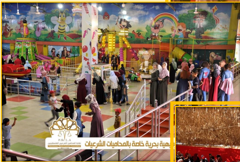
هبة بحرية خاصة بالمحاميات الشرعيات