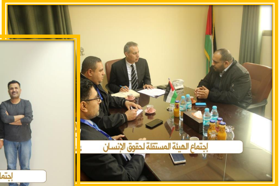
إجتماع الهيئة المستقلة لحقوق الإنسان

زيارة عطوفة نقيب المحامين الشرعيين ووفد من النقابة للهيئة المستقلة لحقوق الانسان لتسخير كافة الامكانيات لخدمة المحامين الشرعيين والارتقاء بمستوى مهاراتهم لرفع كفاءة الخدمة العدلية المقدمة من خلالهم.