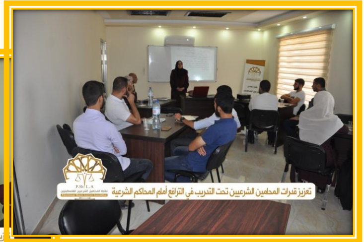
تعزيز قدرات المحامين الشرعيين تحت التدريب في الترافع أمام المحاكم الشرعية

افتتاح دورة المركز الفلسطيني لحقوق الانسان لتمكين المحامين الشرعيين المتدربين من اجتياز امتحان المزاولة بغزة.