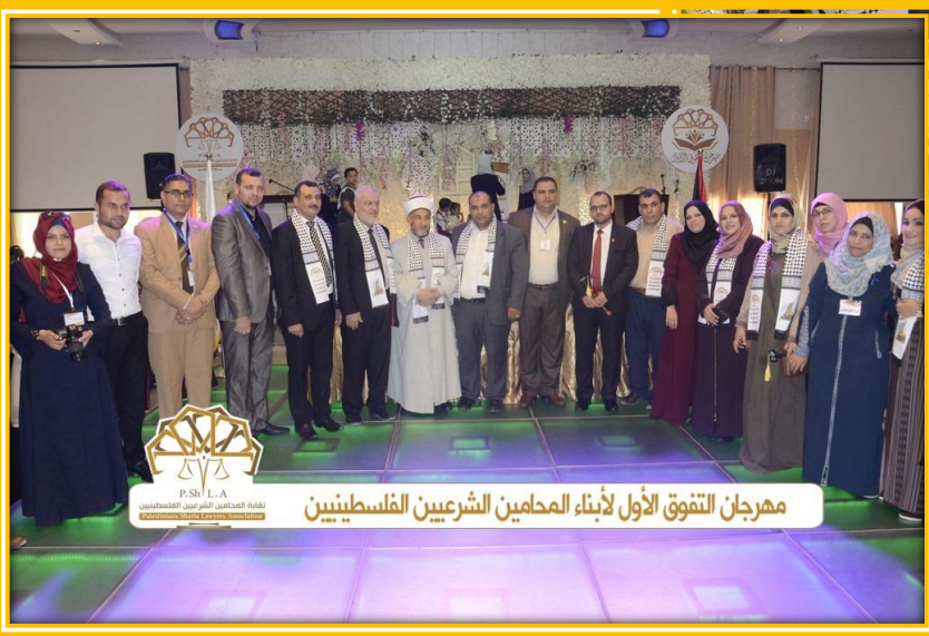
مهرجان التفوق الأول لأبناء المحامين الشرعيين الفلسطينيين