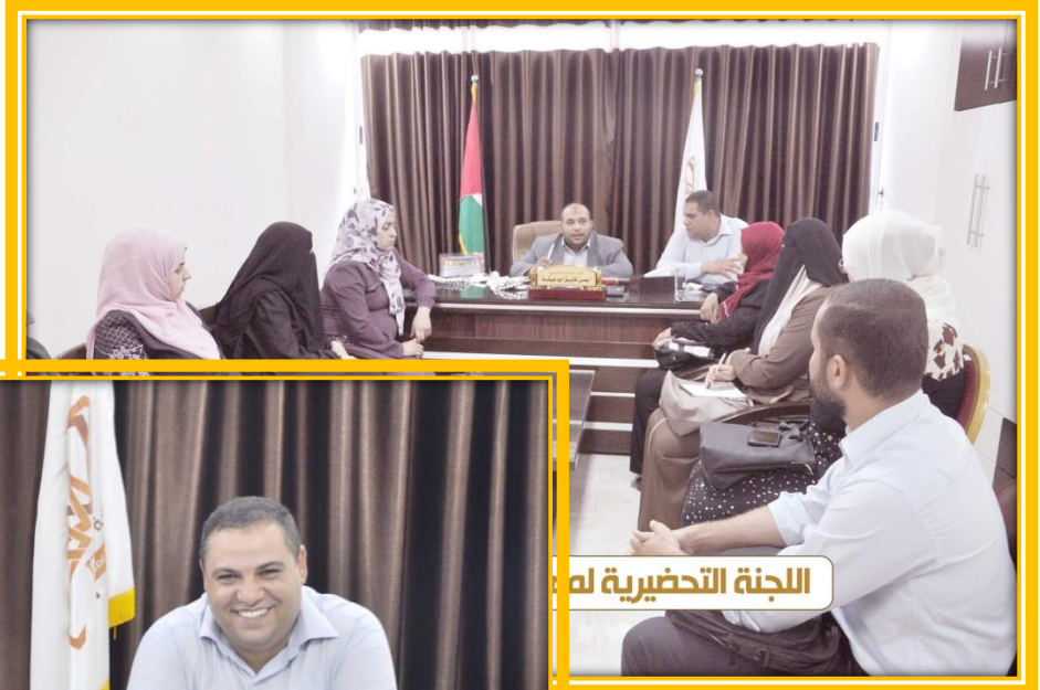
اللجنة التحضيرية له

اجتماع اللجنة التحضيرية لمهرجان التفوق الأول لأبناء المحامين الشرعيين الذي نظمته النقابة في قاعة لازوا على شاطئ بحر غزة ، لمناقشة الأمور الفنية والتقنية الخاصة بالحفل وتوزيع المهام والأعمال على المشرفين على الاحتفال.