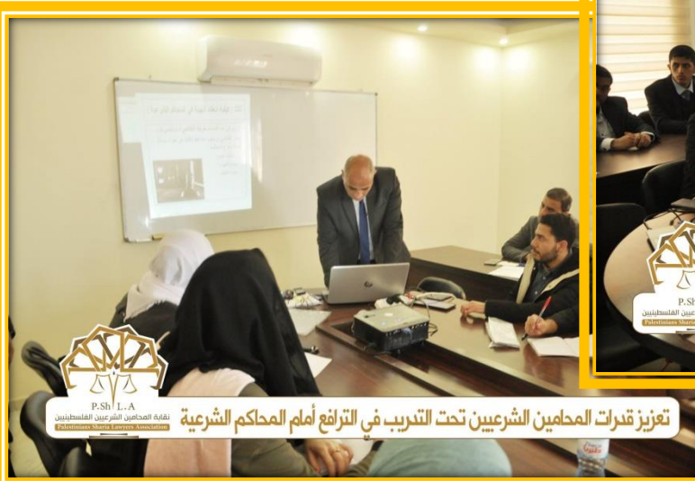
تعزيز قدرات المحامين الشرعيين تحت التدريب في الترافع أمام المحاكم الشرعية