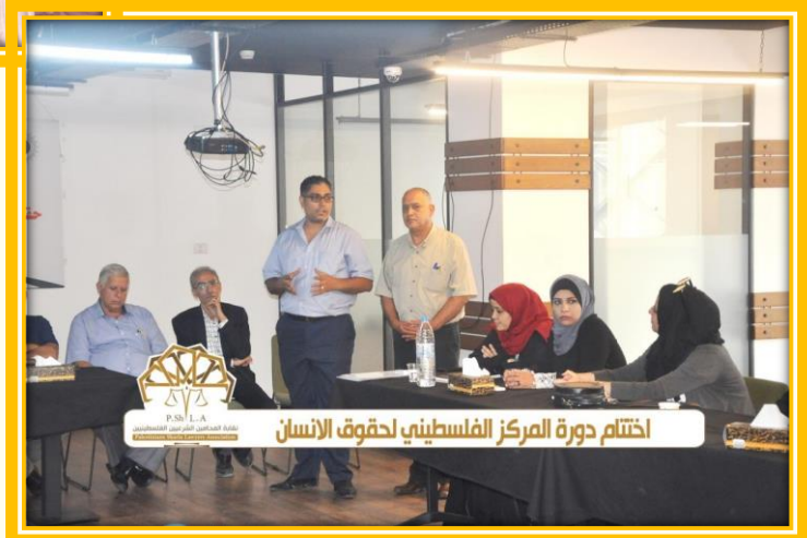
اختتام دورة المركز الفلسطيني لحقوق الانسان

افتتاح دورة تأهيل المحامي الشرعي تحت التدريب لتمكين المحامين الشرعيين المتدربين من اجتياز امتحان المزاولة.