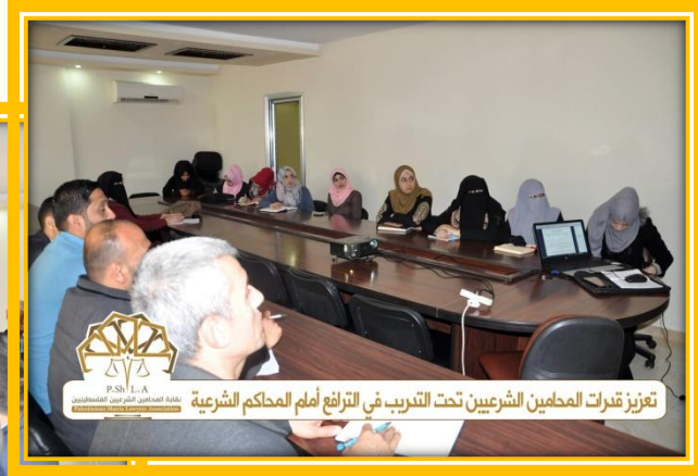
تعزيز قدرات المحامين الشرعيين تحت التدريب في الترافع أمام المحاكم الشرعية