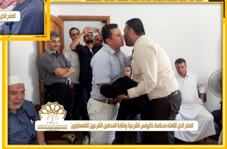
الصلح الذي أقامته محكمة خانيونس الشرعية ونقابة المحامين الشرعيين الفلسطينيين