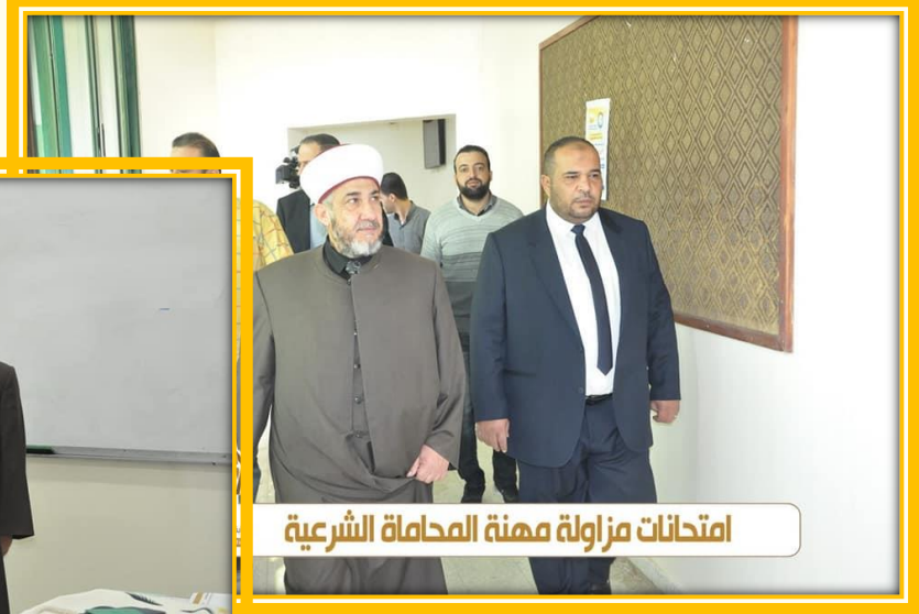
امتحانات مزاولة مهنة المحاماة الشرعية

نظمت نقابة المحامين الشرعيين الامتحان الاول لمزاولة مهنة المحاماة الشرعية لدورة نوفمبر ٢٠١٩ .. حيث اشرف عطوفة نقيب المحامين الشرعيين الاستاذ أيمن ابو عيشة على الامتحانات التي تنظم لأول مرة بإشراف النقابة بالتعاون مع المجلس الأعلى للقضاء الشرعي .. وتفقد عطوفته قاعات الامتحانات بمرافقة سماحة الشيخ الدكتور حسن الجوجو رئيس المجلس الأعلى للقضاء الشرعي للاطلاع على سير عملية الامتحانات والاطمئنان على كافة الامور الخاصة بلوجستيات الامتحانات .. حيث تقدم لامتحان المزاولة ٥٠٠ متدرب ومتدربة ممن تنطبق عليهم شروط التقدم للامتحان.