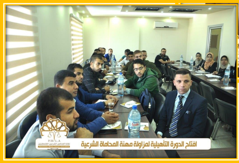
افتتاح الدورة التأهيلية لمزاولة مهنة المحاماة الشرعية