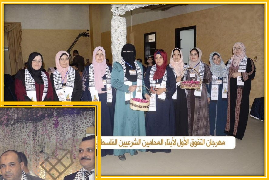
مهرجان التفوق الأول لأبناء المحامين الشرعيين الفلسطينيين

أقامت نقابة المحامين الشرعيين الفلسطينيين حفلاً كرمت فيه ثلة من أبناء المحامين المتفوقين والناجحين، حيث تم تكريم ما يزيد عن ١٦٠ طالب وطالبة بحضور نقيب المحامين الشرعيين عطفة الأستاذ أيمن أبو عيشة وسماحة رئيس المجلس الأعلى للقضاء الشرعي رئيس المحكمة العليا الشرعية الدكتور/ حسن الجوجو ولفيف من المحامين والمحاميات وعوائلهم.