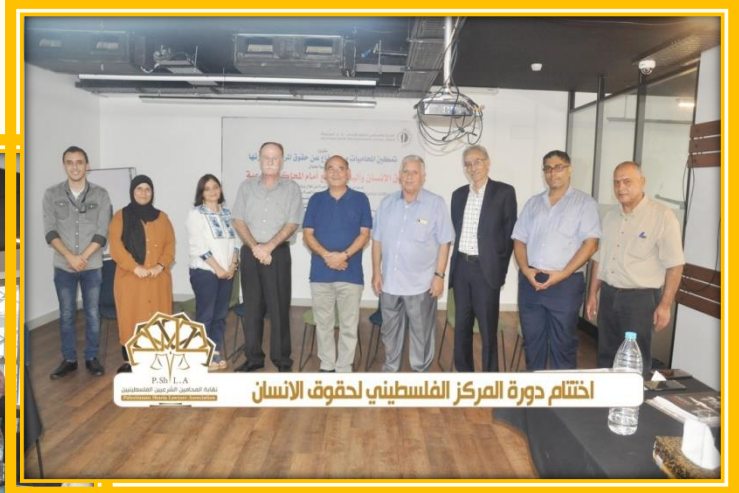
اختتام دورة المركز الفلسطيني لحقوق الانسان