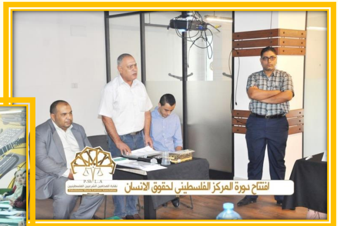
افتتاح دورة المركز الفلسطيني لحقوق الانسان