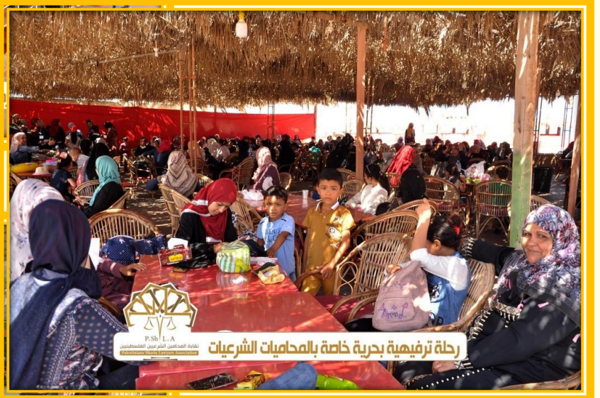
رحلة ترفيهية بحرية خاصة بالمحاميات الشرعيات