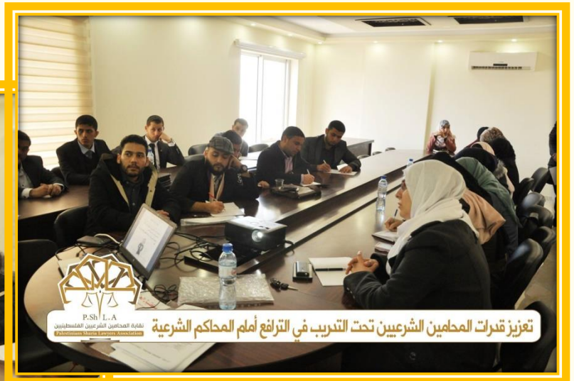
تعزيز قدرات المحامين الشرعيين تحت التدريب في الترافع أمام المحاكم الشرعية

محاضرة من سلسلة محاضرات لجنة التدريب بهدف تعزيز قدرات المحامين الشرعيين تحت التدريب في الترافع أمام المحاكم الشرعية (تحت عنوان دعاوي النفقات بين النظرية والتطبيق).