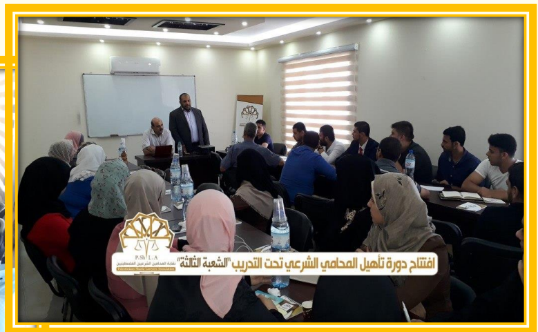
افتتاح دورة تأهيل المحامي الشرعي تحت التدريب الشعبة الثالثة