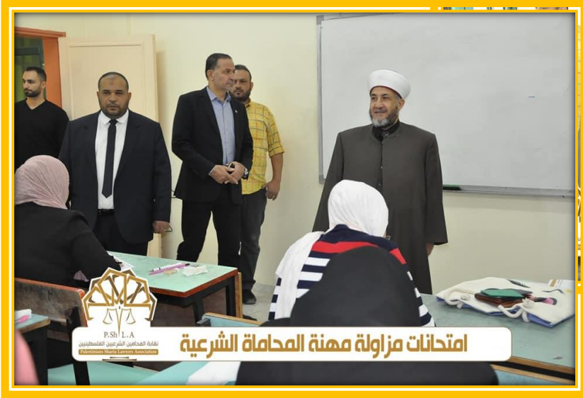
امتحانات مزاولة مهنة المحاماة الشرعية