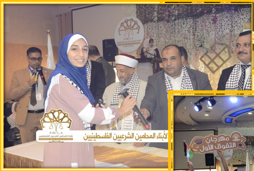
الأبناء المحامين الشرعيين الفلسطينيين