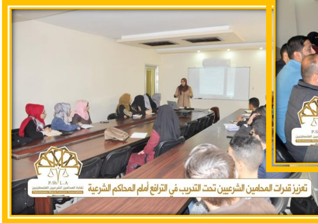
تعزيز قدرات المحامين الشرعيين تحت التدريب في الترافع أمام المحاكم الشرعية

محاضرة من سلسلة محاضرات لجنة التدريب بهدف تعزيز قدرات المحامين الشرعيين تحت التدريب في الترافع أمام المحاكم الشرعية (تحت عنوان دعاوي النفقات بين النظرية والتطبيق).