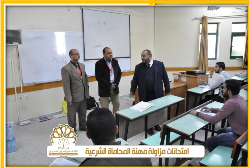
امتحانات مزاولة مهنة المحاماة الشرعية