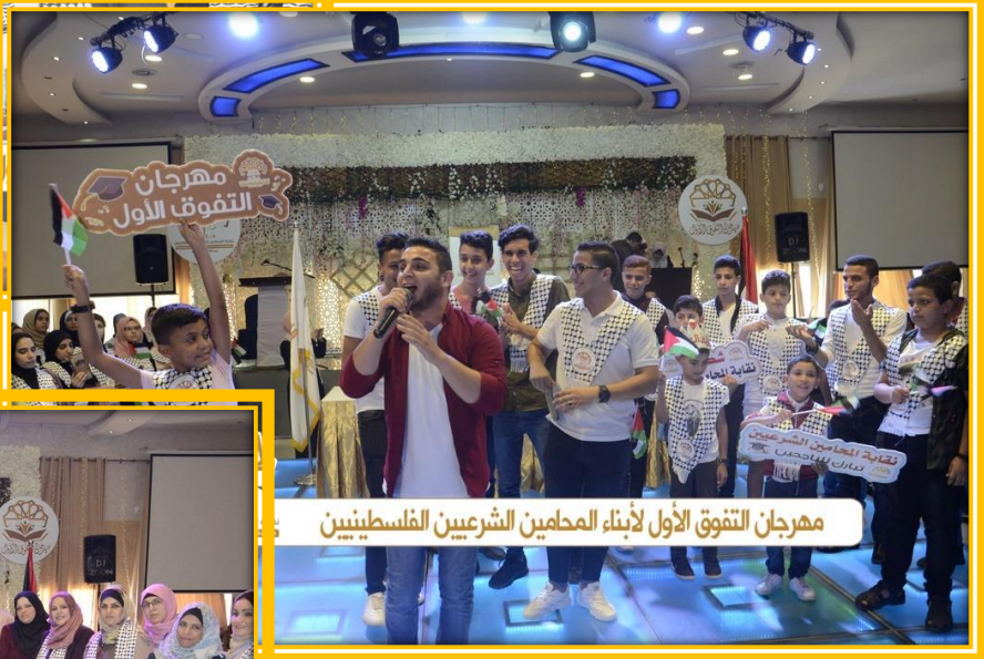
مهرجان التفوق الأول لأبناء المحامين الشرعيين الفلسطينيين