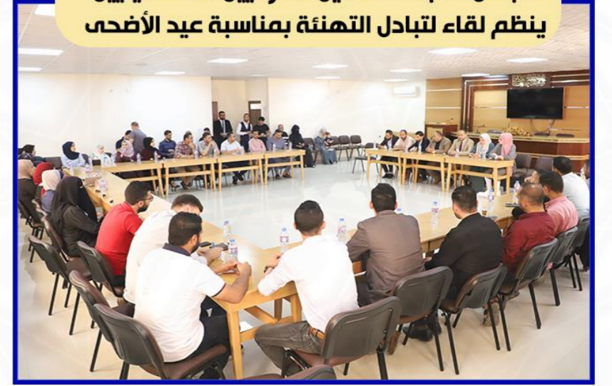
مجلس نقابة المحامين الشرعيين الفلسطينيين ينظم لقاء لتبادل التهنئة بمناسبة عيد الأضحى