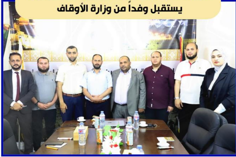
مجلس نقابة المحامين الشرعيين الفلسطينيين يستقبل وفداً من وزارة الأوقاف