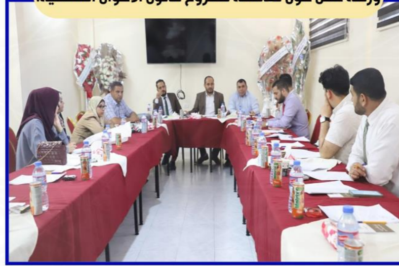
نقابة المحامين الشرعيين الفلسطينيين تنظم ورشة عمل حول مناقشة مشروع قانون الأحوال الشخصية.