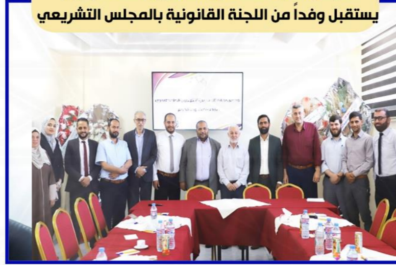
مجلس نقابة المحامين الشرعيين الفلسطينيين يستقبل وفداً من اللجنة القانونية بالمجلس التشريعي