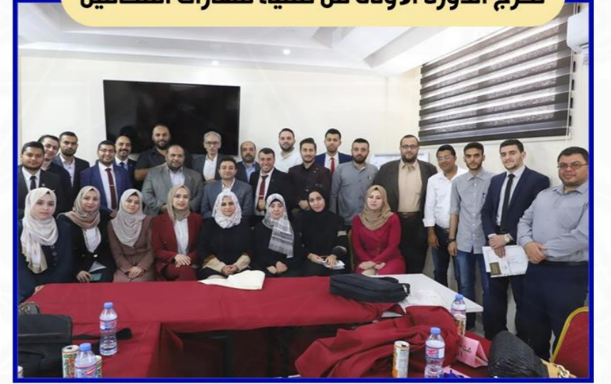
نقابة المحامين الشرعيين الفلسطينيين تخرج الدورة الأولى من تنمية مهارات المحامين