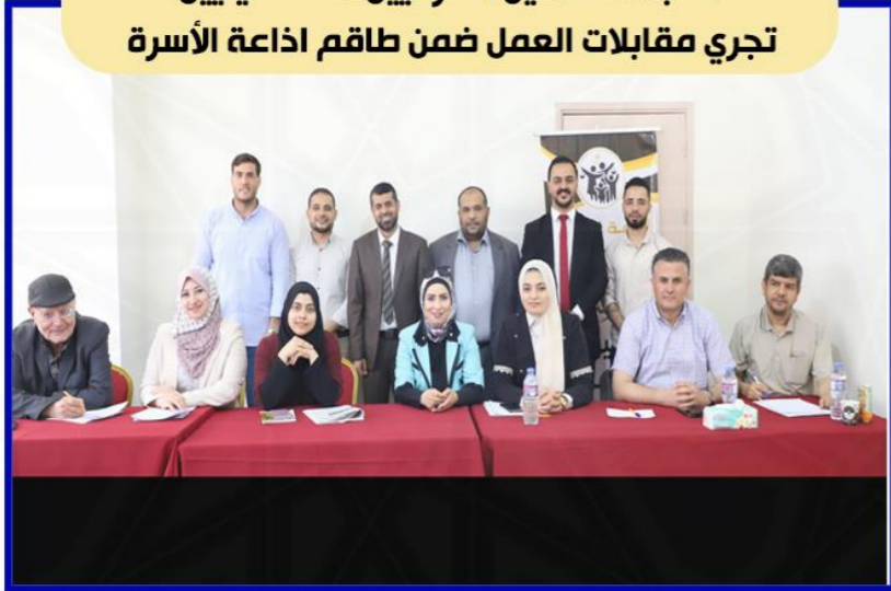
نقابة المحامين الشرعيين الفلسطينيين تجري مقابلات العمل ضمن طاقم إذاعة الأسرة